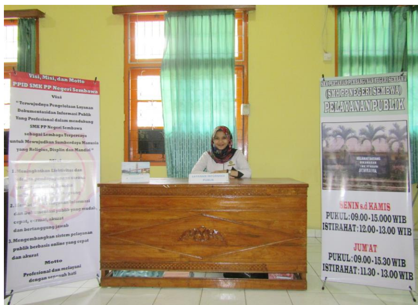
Gambar 1. Meja Layanan Informasi Publik

Selain sarana dan prasarana diatas untuk memenuhi kebutuhan akan informasi dan meningkatkan pelayanan keterbukaan informasi kepada masyarakat, SMK-PP Negeri Sembawa berusaha melakukan pengembangan dalam penyediaan informasi public melalui: