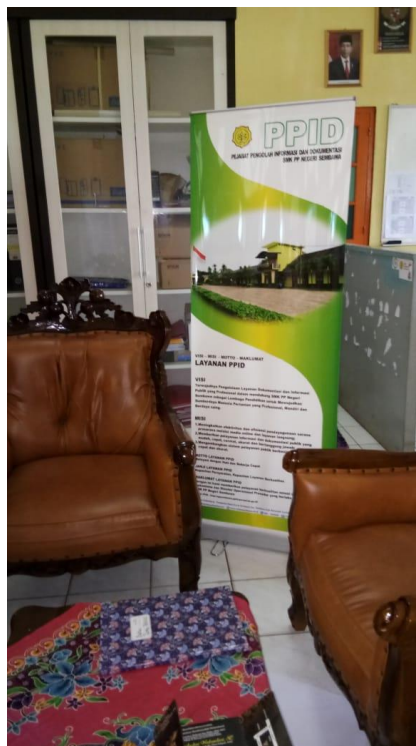
Gambar 2. Ruang Tunggu layanan informasi public

Selain sarana dan prasarana diatas untuk memenuhi kebutuhan akan informasi dan meningkatkan pelayanan keterbukaan informasi kepada